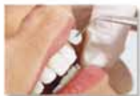
Implantologia Estetica e Funzionale

Centro Medico Odontoiatrico operativo a Torino da 25 anni. Igiene Orale e Profilassi, Terapie Conservative, Endodonzia, Parodontologia, Protesi fissa, mobile e combinata, Chirurgia orale tradizionale e laser assistita, Implantologia tradizionale e a Carico Immediato computer assistita, Estetica, Pedodonzia, Ortodonzia tradizionale e invisibile (Invisalign). Per gli iscritti sconto 15% su tutte le prestazioni per adulti e per l'infanzia; Visita Diagnostica gratuita . Rateizzazione dei Pagamenti per tutte le cure dentali.